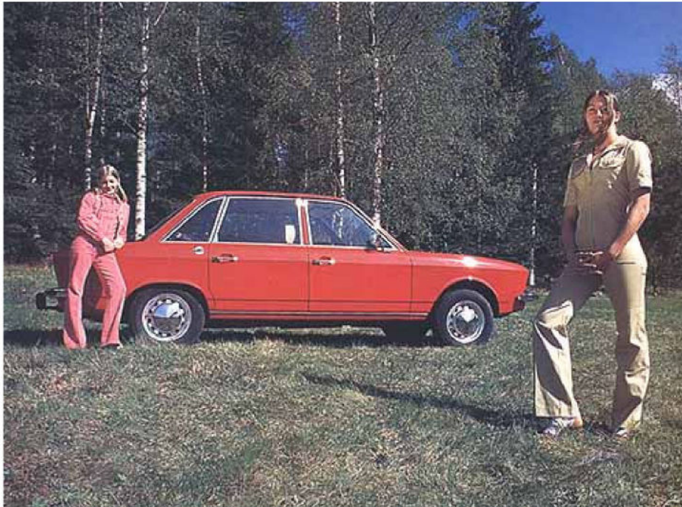
En form som gjord av syv kartong. Volkswagen K 70 formigen jäser av karaktär

Egentligen var modellen en NSU från början, en uppföljare till epokgörande RO 80 - som i sin tur låg årtionden före sin tid i allt utom den usla wankelmotorn under huven. NSU köptes upp av Volkswagen 1969. K 70 var kronjuvelen. 1971 presenterades den - med VW-emblem.