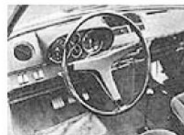
Gut ablesbare Rundinstrumente und richtig plazierte Schalter. Allerdings nicht ganz optimale Sitze