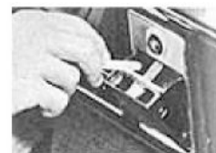
Praktisch: die Sicherungsdose im Armaturenbrett (Foto links). Lästig: Der Aschenbecher mitsamt Anzünder liegt zu weit vom Fahrersitz